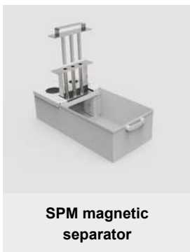
SPM magnetic separator

Контейнер для магнитного сепаратора представляет собой оцинкованный, мелко перфорированный контейнер для эффективного сбора стружки. Легко снимается при заполнении и легко моется.