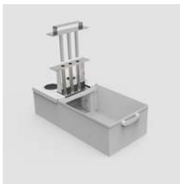
SPM magnetic separator

Контейнер для магнитного сепаратора представляет собой оцинкованный, мелко перфорированный контейнер для эффективного сбора стружки. Легко снимается при заполнении и легко моется.